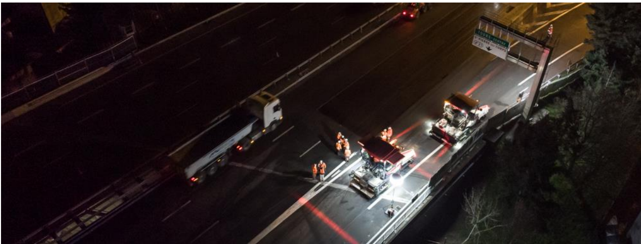
Le chantier mobile dans la nuit du 22 mars au niveau de l'échangeur de Tours Centre.

Dans le cadre de sa politique d'entretien et de maintenance du patrimoine autoroutier, VINCI Autoroutes a entrepris depuis le 8 mars dernier la rénovation des chaussées entre les échangeurs de Tours Nord (n°19) et de Chambray-lès-Tours (n°23) dans les deux sens de circulation.