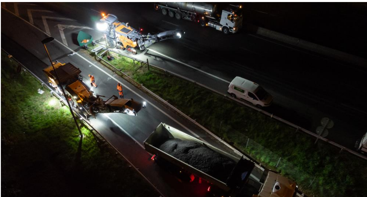
Le chantier mobile dans la nuit du 6 avril au niveau de l'échangeur de Saint-Avertin.

Dans le cadre de sa politique d'entretien et de maintenance du patrimoine autoroutier, VINCI Autoroute a entrepris depuis le 8 mars dernier la rénovation des chaussées entre les échangeurs de Tours Nord (n°19) et de Chambray-lès-Tours (n°23) dans les deux sens de circulation. Chaque semaine, les compagnons sont à pied d'œuvre les nuits du lundi au jeudi pour réaliser des chaussées neuves !