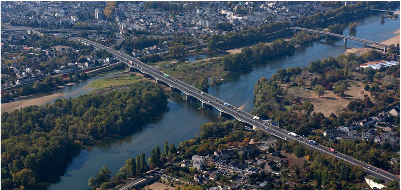
Autoroute A10 dans la traversée de Tours, les viaducs qui enjambent la Loire.

VINCI Autoroutes déploie des moyens exceptionnels pour limiter la durée de ces travaux dans le temps ainsi que la gêne occasionnée. Par ailleurs, compte-tenu des perturbations prévisibles, un dispositif d'information inédit est mis en place pour accompagner les conducteurs dans leurs déplacements.